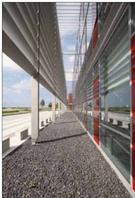
Hoe groter de lamel, hoe groter de afstanden die men in één keer met één lamel kan overbruggen