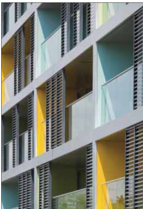
Behalve functioneel, maken schuifpanelen een voorgevel ook levendiger of moderner (bij renovatie)