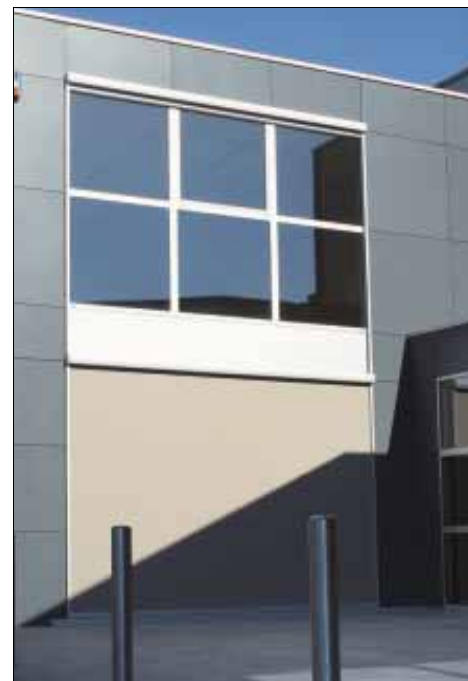
Hoe donkerder het doek, hoe beter de doorkijk. Bij een wit doek is de weerkaatsing veel groter

tor en automatische sturing. Een uitval van 6 à 9 m is realiseerbaar maar niet zonder extra steunpunten en een zwaarder profiel. Breedtes van 15 m zijn realiseerbaar. In omgevingen met een risico op stevige rukwinden wordt dit systeem afgeraden.